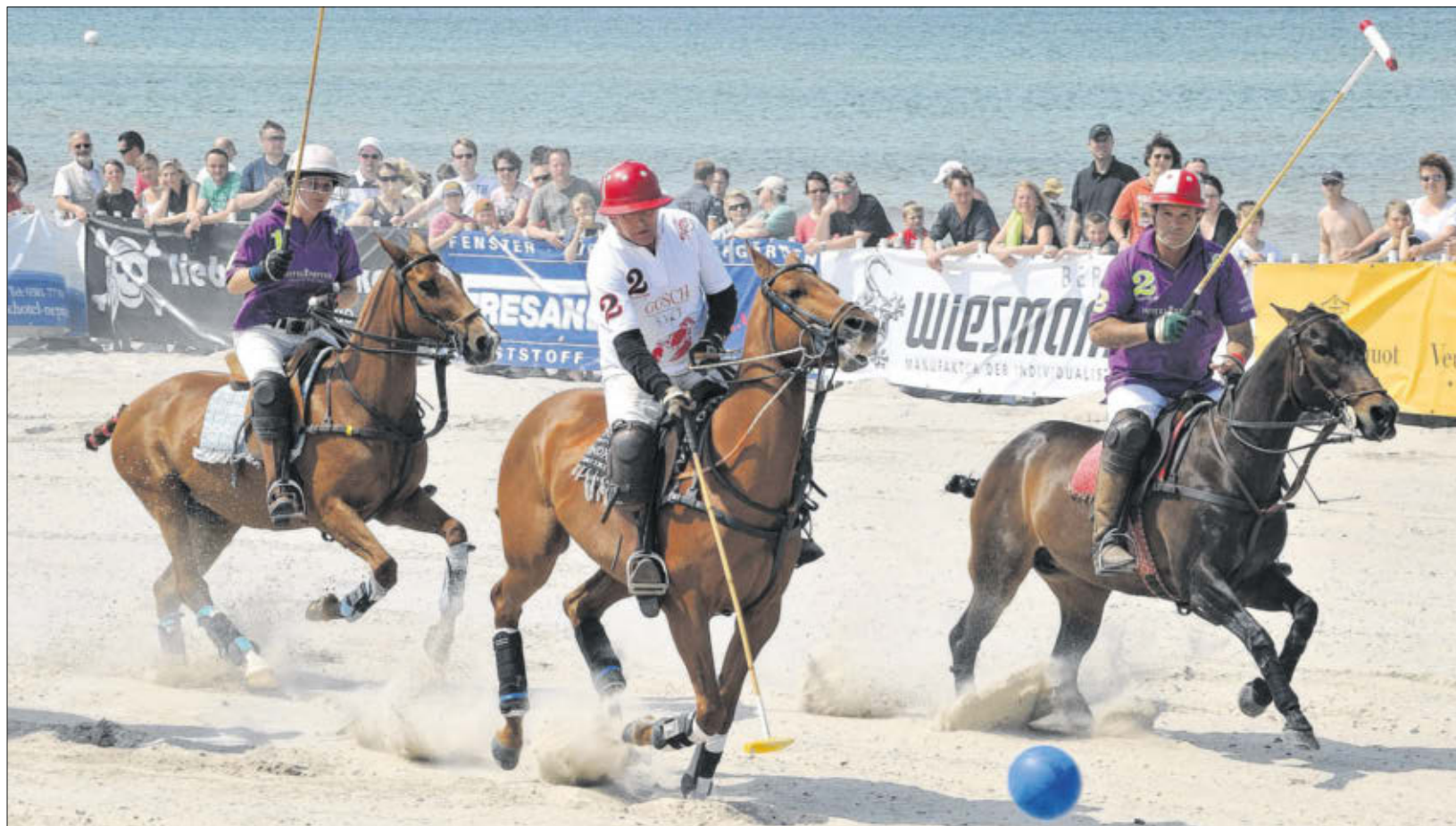
Die Zuschauer stehen am Warnemünder Strand unmittelbar am Spielfeld. Am 3. Juni startet das Polo-Turnier.

Der Minister verweist darauf, dass der Pferdesport auch bei den Touristen beliebt ist. 104 000 reitende Gäste waren im vergangenen Jahr im Land unterwegs. Er hoffe, dass sie wiederkommen – vielleicht schon zum Turnier in Warnemünde.